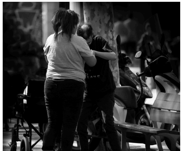
Photo presented in the photography contest organized by USO in commemoration of the World Day for Decent Work. Title "Caregiver", Author: José Reyes Benzulce