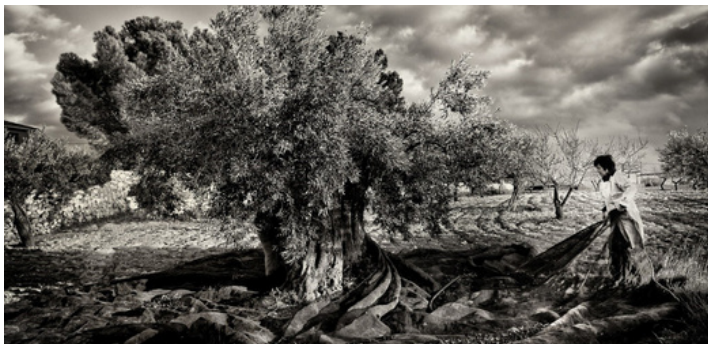
Foto ganadora en el concurso de fotografía convocado por USO con motivo de la Jornada Mundial por el Trabajo Decente. Título: "Valiente".

5. Trabajadores del sector de cuidados y servicios personales. Los trabajadores de dependencia, como cuidadores de personas mayores o con discapacidad.