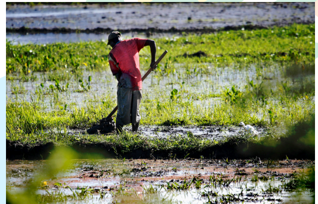
Título de la foto: "Trabajo en el campo". Autor: Alex Castro Soto del Valle