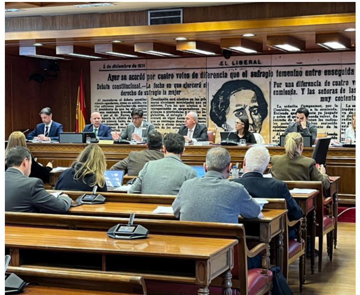
Enlace a la noticia - web USO

En su informe a los portavoces de los distintos grupos políticos en el Senado, la USO ha destacado que España sigue liderando el paro en la Unión Europea , con tasas que duplican la media comunitaria y una especial incidencia del paro juvenil y de larga duración. En su intervención, Pérez destacó que el 46% de los desempleados en España lleva más de un año sin trabajo, mientras que uno de cada tres lleva más de dos años en paro.