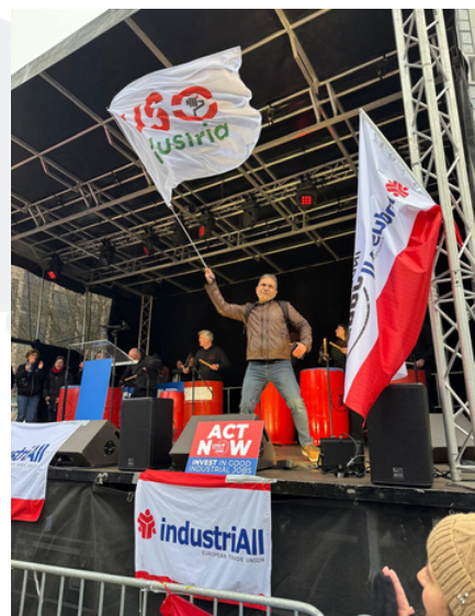
Enlace a la noticia - web USO Industria