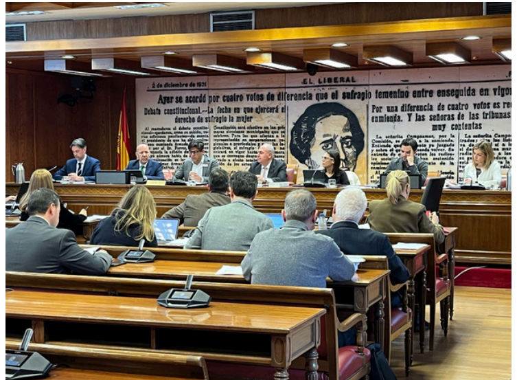
Link to the article - website USO