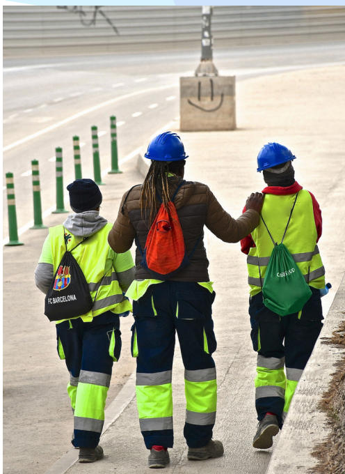
Título de la foto: "Tres son compañía". Autor: Óscar Alfredo Parra Prieto