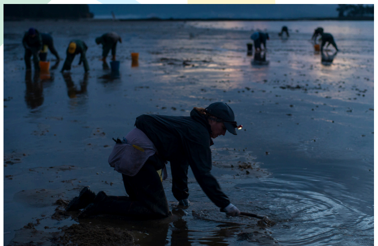
Título de la foto: "Mariscadora". Autora: Mónica Vila